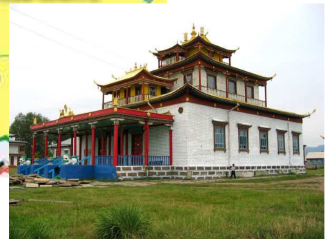
Иволгинский дацан, место паломничества буддистов