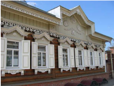
старые избы в Иркутске