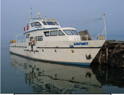
теплоходные экскурсии по Байкалу